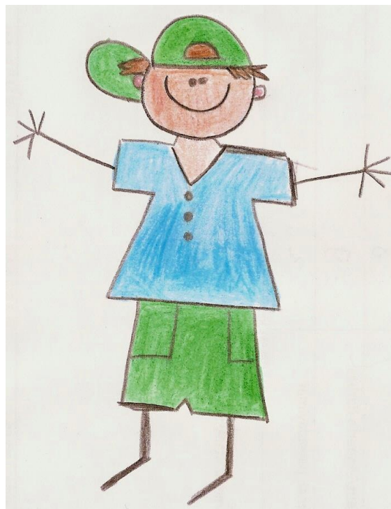
Būsimasis dvyliktokas IGNAS