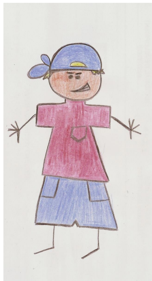
Mokyklą metęs TADAS