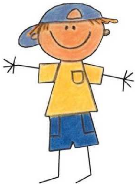
Būsimasis dvyliktokas LUKAS